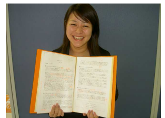
マイ・キャリアブック完成！