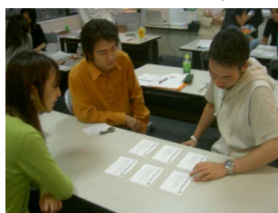
コンピテンシーカードを使ったグループディスカッション